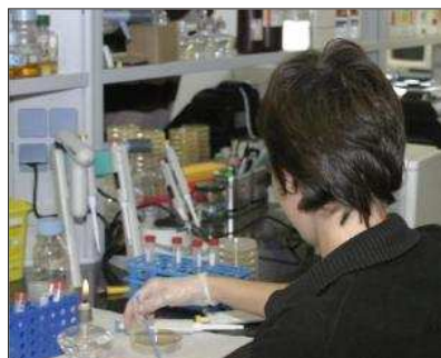
Una investigadora trabaja en un laboratorio.

Un grupo internacional de investigadores, con participación española, ha dado nuevos pasos en el conocimiento genético de las enfermedades complejas, aquellas que dependen de factores relacionados con los genes y ambientales, como la dieta.