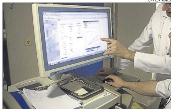
ANÁLISIS. Representación gráfica de los resultados obtenidos con un paciente.

LA EPIDEMIA DEL SIGLO XXI // «La enfermedad a la que se dirige esta calculadora es tan habitual que ya se considera la nueva epidemia del siglo XXI», prosigue Bayés. En Catalunya, el 7% de la población tiene insuficiencia cardíaca, un porcentaje que aumenta al ritmo que se incrementa la esperanza de vida media. De hecho, si solo se computan los mayores de 75 años, se alcanza entonces el 18%. Se trata de personas que previamente han sufrido un infarto de miocardio, que han sido tratados con éxito y que se han salvado, pero cuyos músculos del corazón han quedado debilitados. «La insuficiencia cardíaca