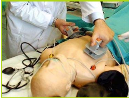
Investigadores europeos y estadounidenses han descubierto tres nuevas características genéticas relacionadas con el infarto agudo de miocardio.

Un consorcio de investigadores europeos y norteamericanos ha descubierto tres nuevas características genéticas relacionadas con el infarto agudo de miocardio -primera causa de discapacidad y muerte en los países desarrollados- y ha confirmado otras seis identificadas en estudios anteriores.